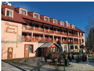
Penzión ZORA Tatranská Lomnica